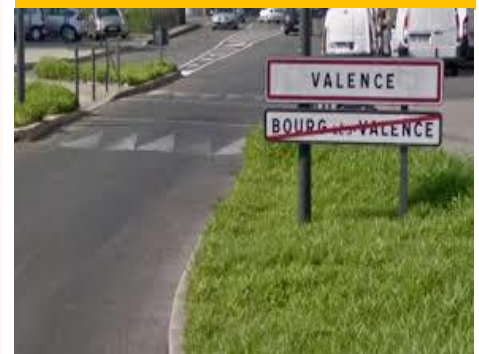
La piste cyclable